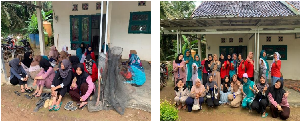
Gambar 1. Foto bersama masyarakat