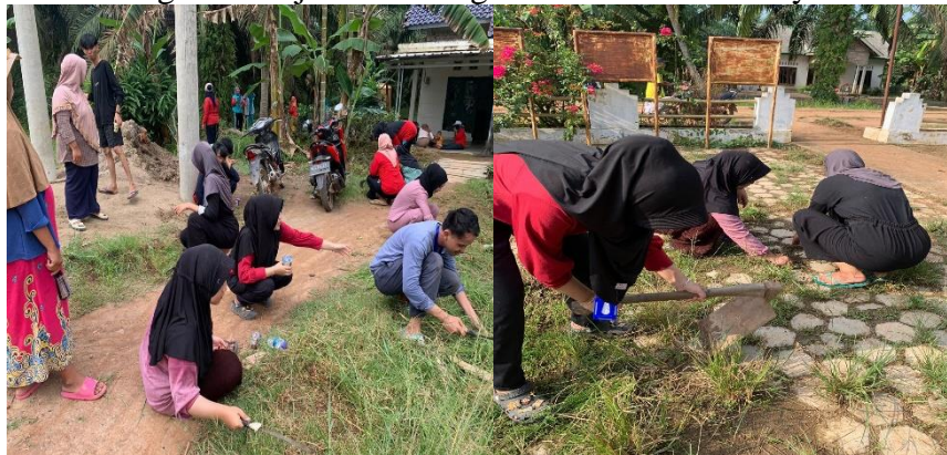
Gambar 2. Kerja bakti di kantor kades dan puskesmas

Melakukan aksi lapangan berupa kerja bakti bersama warga untuk membersihkan lingkungan. Pembagian tugas dan peran kepada setiap peserta gotong royong agar semua memiliki pemahaman yang jelas tentang apa yang harus dilakukan. Setelah itu, adalah pelaksanaan tugas sesuai dengan rencana yang telah disusun. Koordinasi antar peserta gotong royong menjadi kunci di sini untuk menghindari tumpang tindih dan memastikan semua pekerjaan dilakukan dengan efisien. Selama pelaksanaan, komunikasi terbuka dan kolaboratif juga penting agar semua pihak dapat saling mendukung dan mengatasi hambatan yang mungkin muncul. Secara umum kondisi lingkungan di kantor desa dan puskesmas cukup memprihatinkan, banyak rumput tinggi yang tumbuh disekitaran pemukiman. Oleh karena itu perlu melakukan kegiatan kerja bakti ini agar terlihat bersih dan nyaman dan sehat.